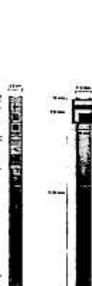
Jalon de boisage JB - PNC JB - CG30