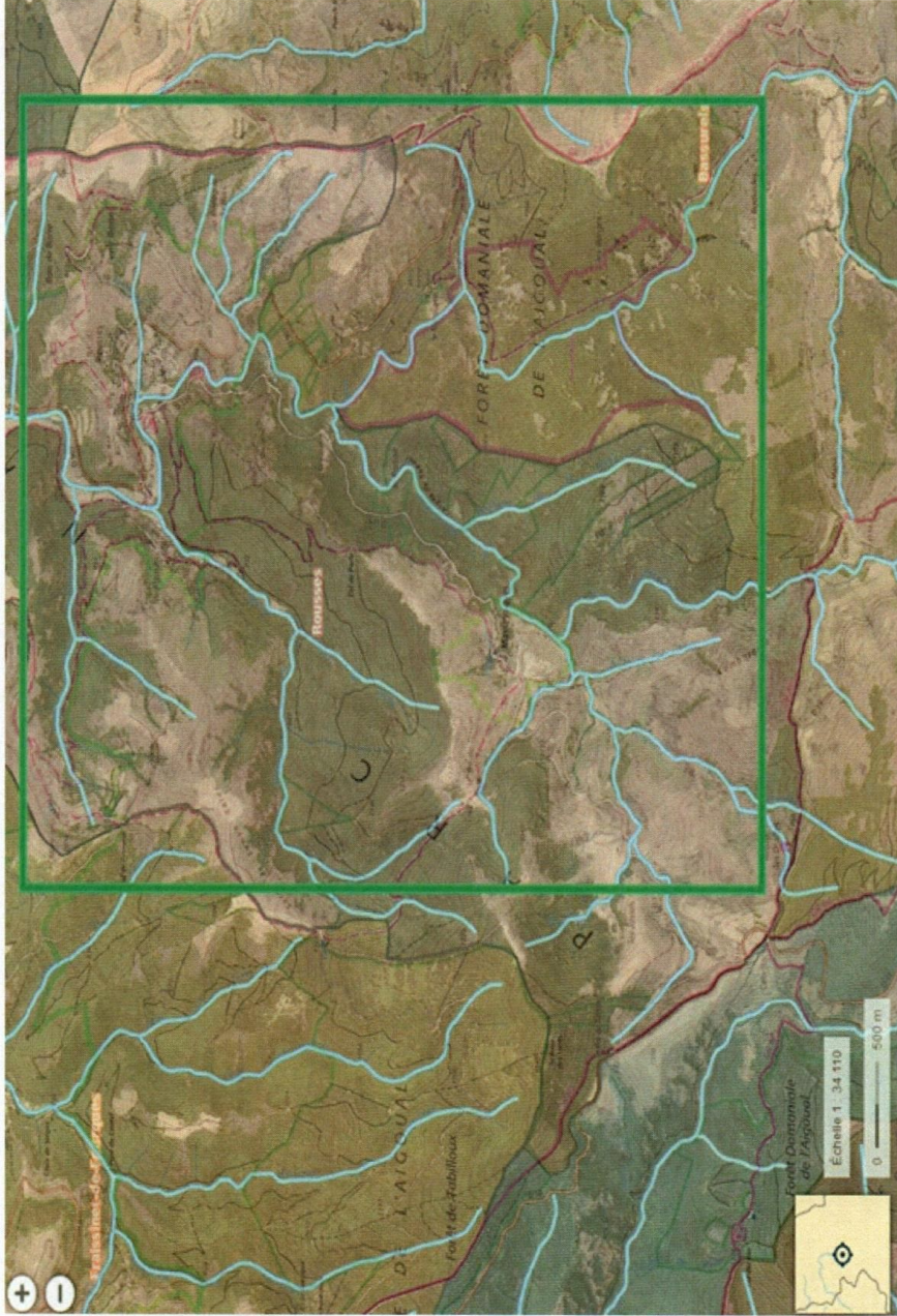
Zone de prospection n°1

Parc national des Cévennes 6 bis place du Palais • 48400 Florac-Trois-Rivières Tél. +33 (0)4 66 49 53 00 • Fax: +33 (0)4 66 49 53 02 www.cevennes-parcnational.fr • info@cevennes-parcnational.fr