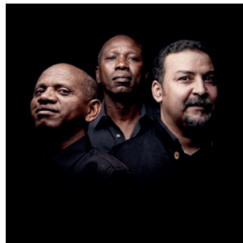
Ballaké Sissoko, Rajery, Driss El Maloumi