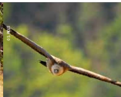
Le vautour fauve