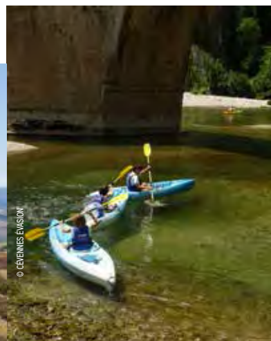
Canoë dans les gorges du Tarn