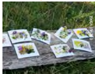
Cours de dessin en pleine nature