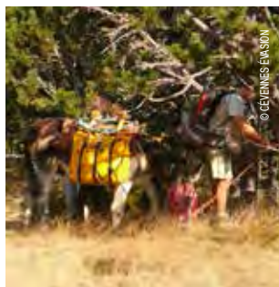
Halte en pleine nature