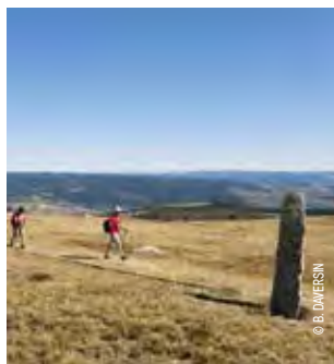
Les pierres levées du Mont Lozère