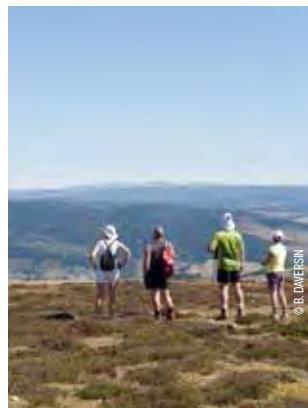
Au sommet du Mont Lozère