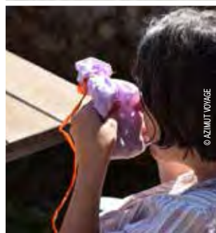
Identification d'essences végétales