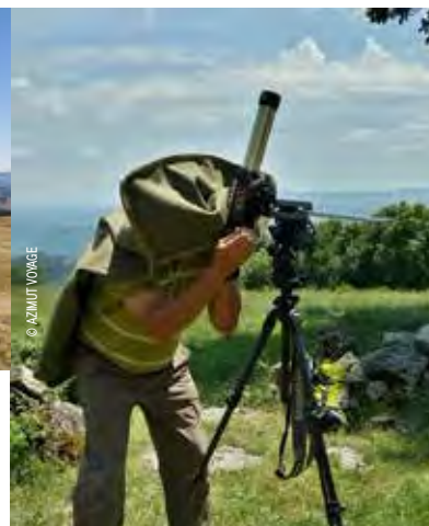
Observation à la lunette