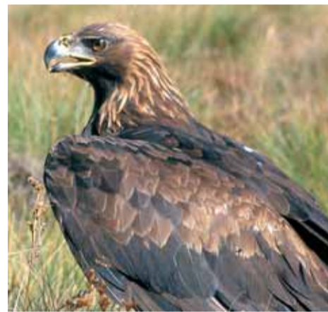
En 2007 le taux d'échec de reproduction se réduit à 25 %.

Les gardes-moniteurs du parc national, en partenariat avec les associations de protection de la nature locales, effectuent un suivi de la reproduction de l'aigle royal sur le territoire du parc depuis de nombreuses années.