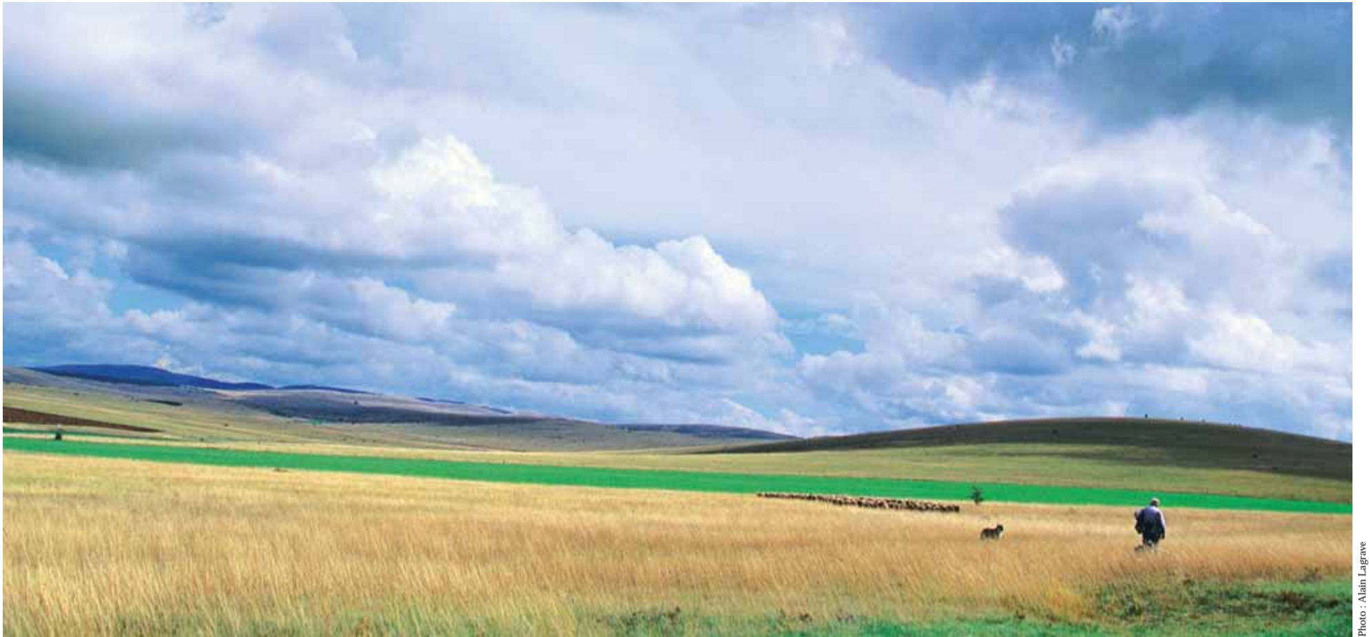
Berger sur le causse Méjean